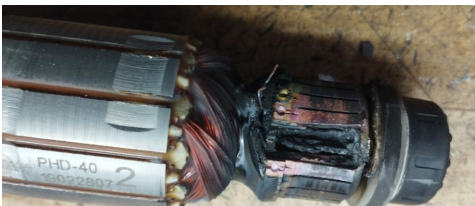
Obr.2 Poškodenie komutátora rotora