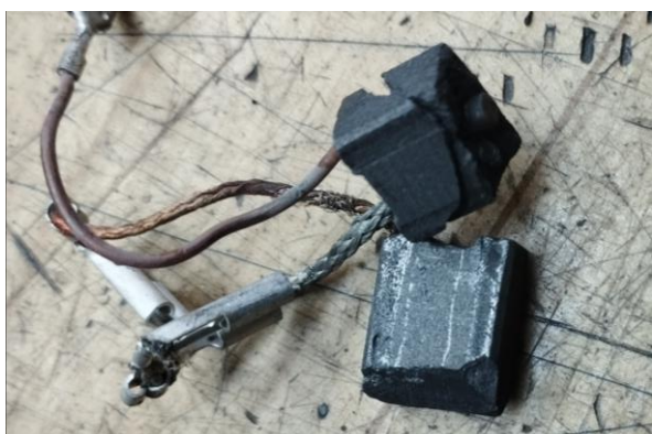
Obr.3 Opotrebené uhlíky