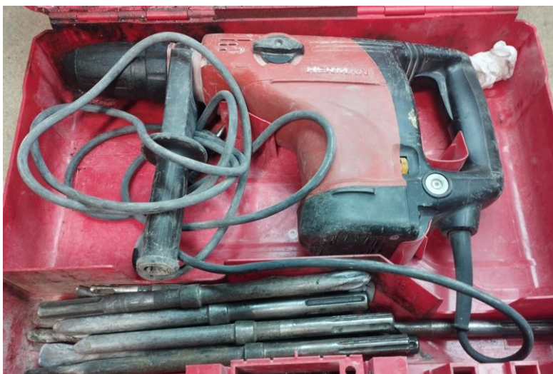
Obr.1 Stav náradia pri prijme