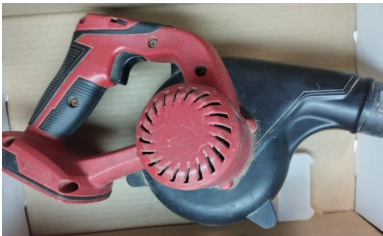
Obr.1 Stav náradia pri príjme