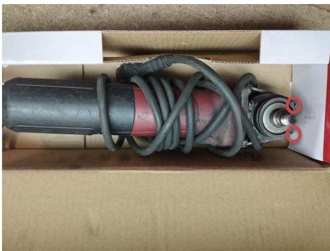
Obr.1 Stav náradia pri príjme (vypadnuté skrutky krytu prevodovky)