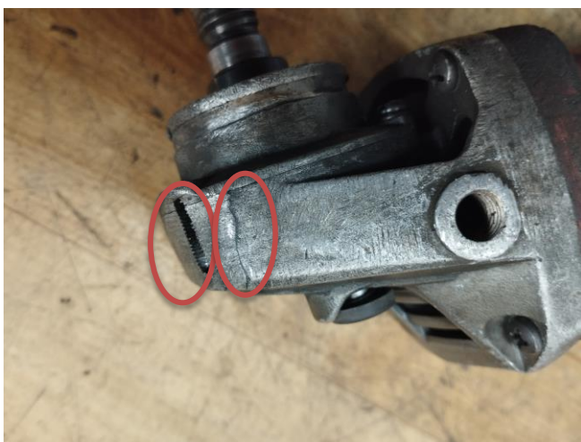
Obr.2 Vydraté a prasknuté púzdro prevodovky